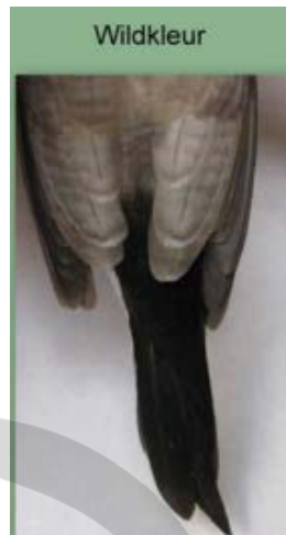
Detalle de las alas y la cola

Cabeza: Craneo y careta son de un bruno claro, marmeado en negro. Mejillas: bruo claro. Garganta: Beigebruno, bige bordeado fluyendo hacia el pecho.